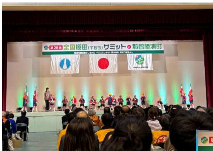
社会福祉法人若葉福祉会 わかば保育園の園児による鼓笛隊の演奏