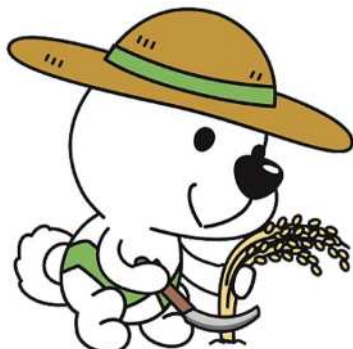
和歌山県PRキャラクター「きいちゃん」