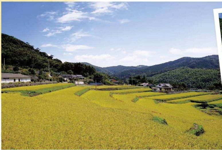
自然の色の美しさ「段の華」